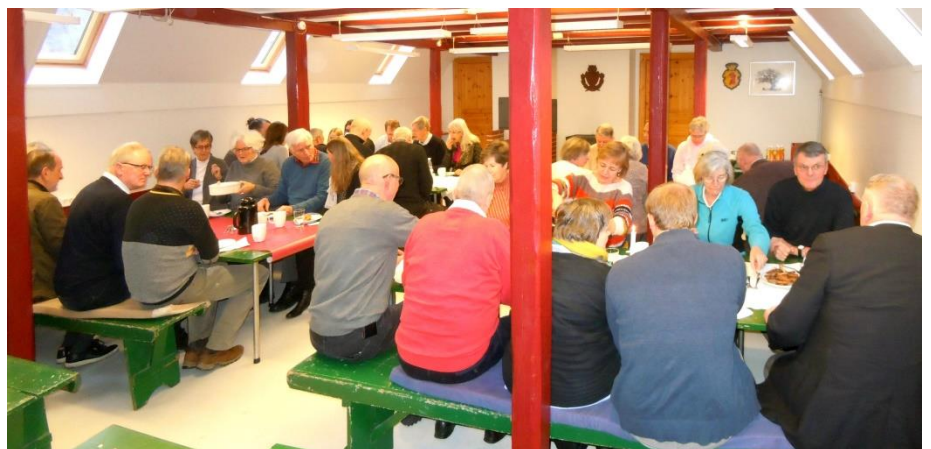
Kaffe og æbleskiver

lemstilbagegang på et enkelt medlem, har foreningen haft medlemstilgang. I 2017 fik foreningen 54 nye medlemmer og en nettotilgang på 26 medlemmer, således at foreningen nu har 330 medlemmer.