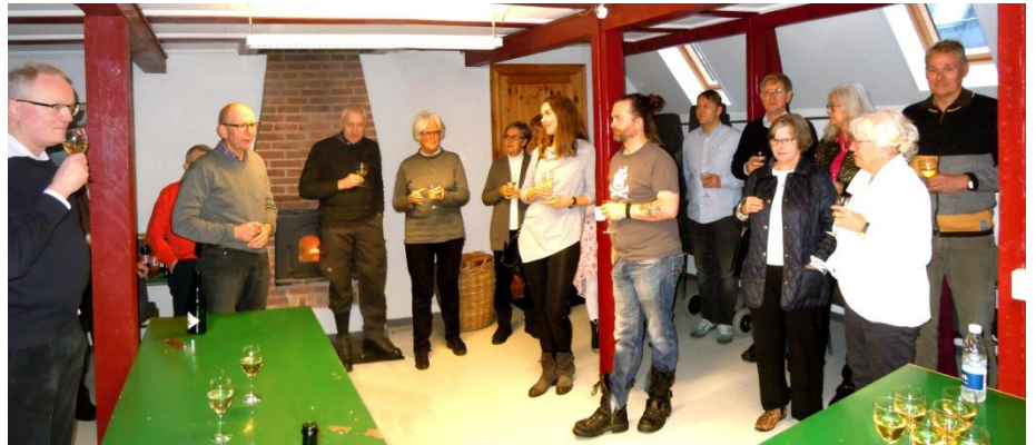
Høje Formand byder velkommen

For anden gang - i den nuværende form - gennemførte foreningen nytårskur på Bjerget.