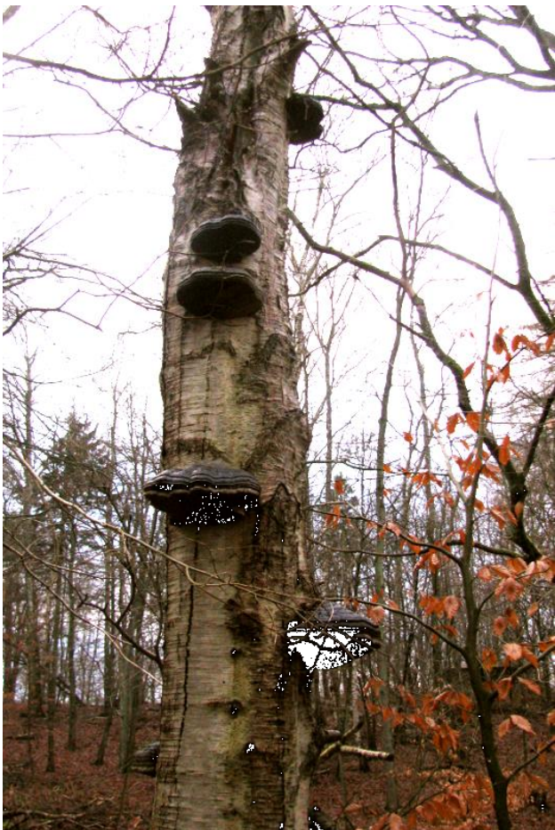
Tøndersvampe på knækket birk